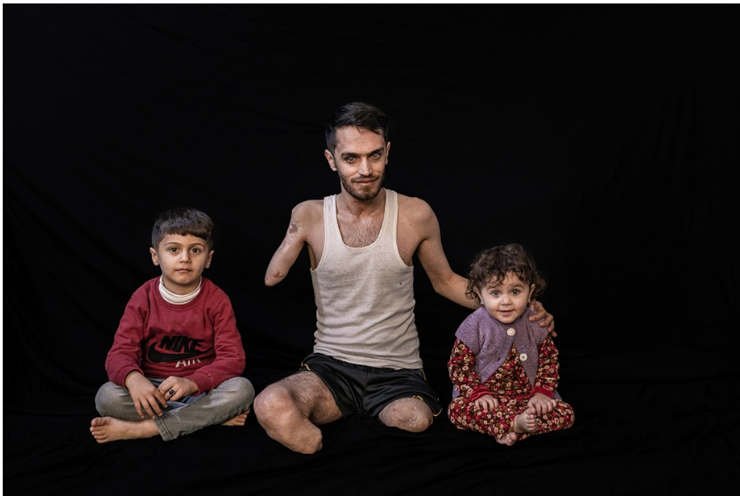
© Younes Mohammad, Irak (Agentur Middle East Images)