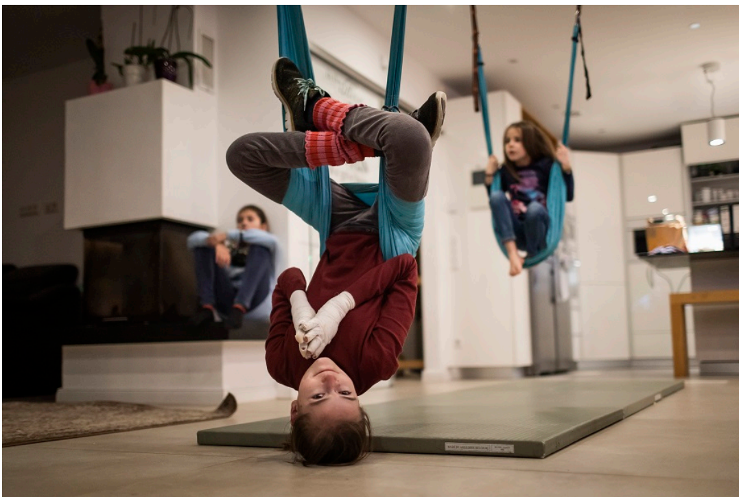
© Jörg Volland, Deutschland (Absolvent der Hochschule Hannover)