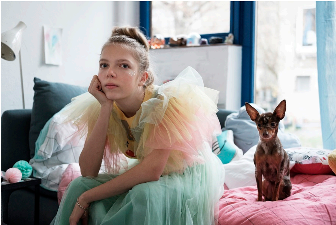
© Feli & Pepita von Ehrenfeld, Deutschland