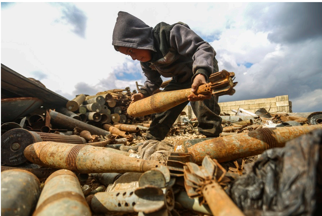
© Ali Haj Suleiman, Syrien (Agentur Middle East Images)